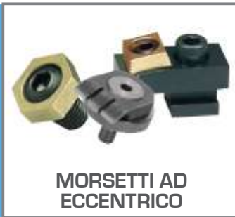
MORSETTI AD ECCENTRICO

Mini bloccaggi dal basso profilo progettati per occupare poco spazio sulla base di fissaggio con forze di serraggio fino a 150 kN. Blocchetti a basso profilo a cuneo e pressori laterali che garantiscono una pressione costante di fissaggio.