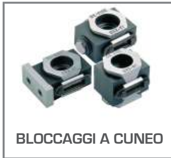
BLOCCAGGI A CUNEO