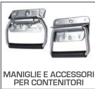
MANIGLIE E ACCESSORI PER CONTENITORI