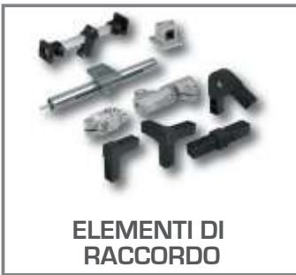
ELEMENTI DI RACCORDO