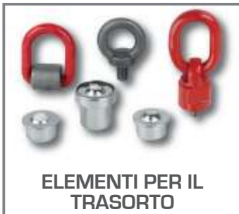
ELEMENTI PER IL TRASORTO

MANIGLIE A STAFFA, MANIGLIE AD ARCO, MANIGLIE TUBOLARI, MANIGLIE AD INCASSO, MANIGLIE PROFILATE, MANIGLIE RIPIEGABILI, MANIGLIE PER CONTENITORI, ANGOLARI DI PROTEZIONE, PARASPIGOLI, SERRATURE GIREVOLI CON CILINDRO DI SICUREZZA, SERRATURE GIREVOLI CON IMPUGNATURA A T, SERRATURE GIREVOLI A COMPRESSIONE, GUIDE TELESCOPICHE AD ESTRAZIONE PARZIALE O TOTALE, MAGNETI CILINDRICI, MAGNETI PIATTI, MAGNETI A BOTTONE, MAGNETI AD U, GOLFARI, GOLFARI GIREVOLI, GRILLI AD OMEGA, SFERE PORTANTI.