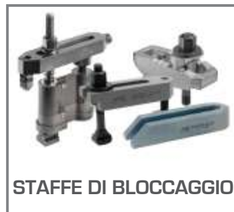
STAFFE DI BLOCCAGGIO