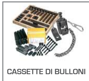
CASSETTE DI BULLONI