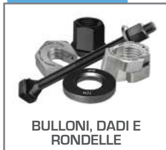
BULLONI, DADI E RONDELLE