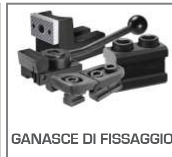
GANASCE DI FISSAGGIO