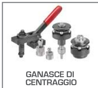
GANASCE DI CENTRAGGIO