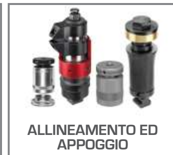
ALLINEAMENTO ED APPOGGIO