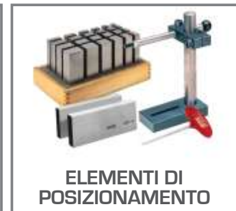
ELEMENTI DI POSIZIONAMENTO