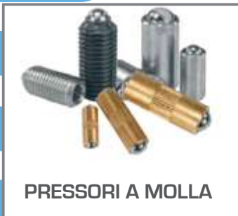
PRESSORI A MOLLA

Vasta gamma di prodotti per il posizionamento come pressori a molla con spinte fino a 240 N e carichi massimi fino a 120 KN, perni di arresto in acciaio in varie finiture e resina termoplastica, appoggi, supporti basculanti e molto altro.