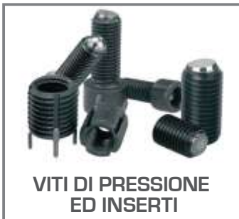
VITI DI PRESSIONE ED INSERTI