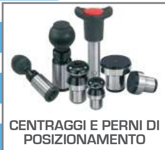
CENTRAGGI E PERNI DI POSIZIONAMENTO