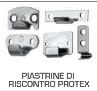
PIASTRINE DI RISCONTRO PROTEX