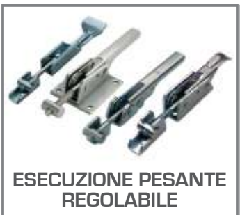
ESECUZIONE PESANTE REGOLABILE