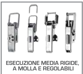
ESECUZIONE MEDIA RIGIDE, A MOLLA E REGOLABILI