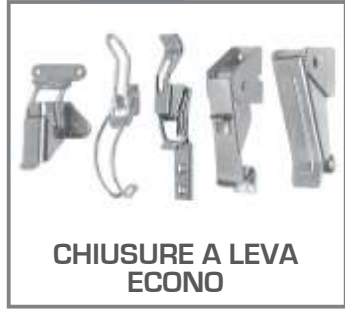
CHIUSURE A LEVA ECONO