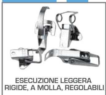
ESECUZIONE LEGGERA RIGIDE, A MOLLA, REGOLABILI