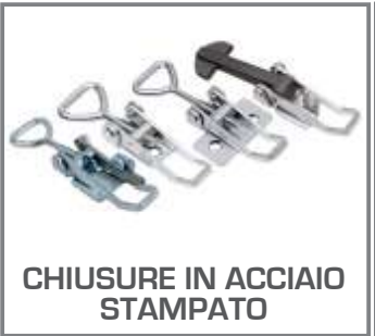
CHIUSURE IN ACCIAIO STAMPATO