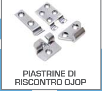
PIASTRINE DI RISCONTRO OJOP

CERNIERE A BASE STRETTA, CERNIERE A BASE LARGA, CERNIERE CON FORI DI FISSAGGIO, CERNIERE PER SALDATURA, CERNIERE COMPLETAMENTE CHIUSE, CERNIERE CON GANCIO CORTO, CERNIERE CON GANCIO MEDIO, CERNIERE CON GANCIO LUNGO, CERNIERE CON MOLLA DI RITORNO, CERNIERE CON GANCIO RICURVO, CERNIERE CON ARRESTO DI SICUREZZA, CERNIERE LUCCHETTABILI, CERNIERE CON SERRATURA