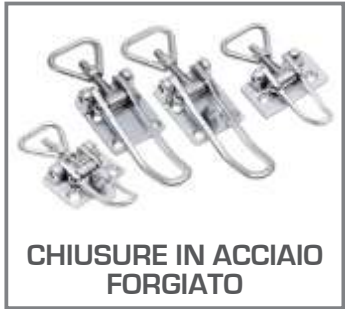
CHIUSURE IN ACCIAIO FORGIATO