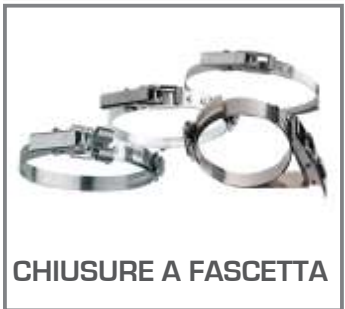
CHIUSURE A FASCETTA