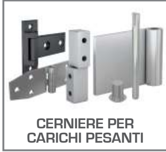
CERNIERE PER CARICHI PESANTI