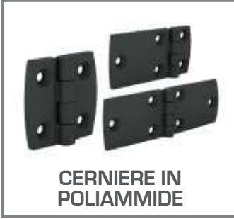
CERNIERE IN POLIAMMIDE