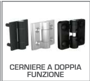
CERNIERE A DOPPIA FUNZIONE