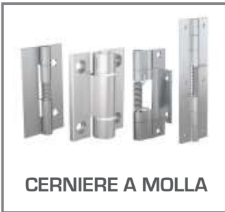
CERNIERE A MOLLA