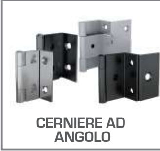
CERNIERE AD ANGOLO