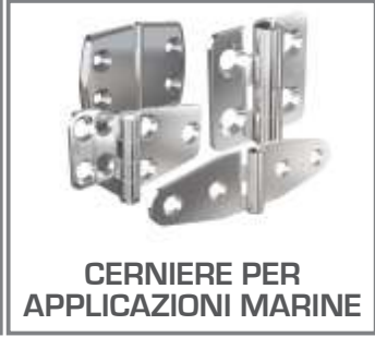
CERNIERE PER APPLICAZIONI MARINE