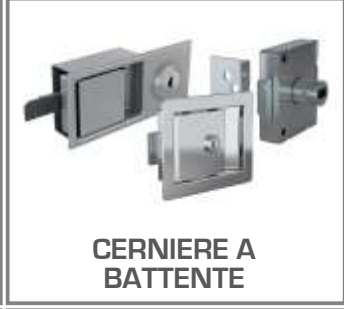
CERNIERE A BATTENTE

CERNIERE CON GANCIO RICURVO, CERNIERE CON ARRESTO DI SICUREZZA, CERNIERE LUCCHETTABILI, CERNIERE CON SERRATURA