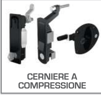
CERNIERE A COMPRESSIONE