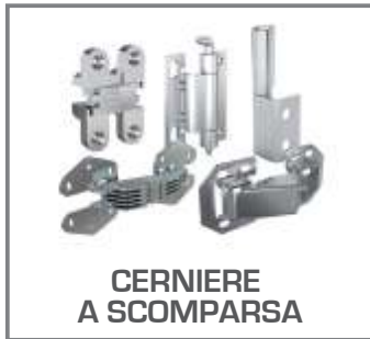
CERNIERE A SCOMPARSA