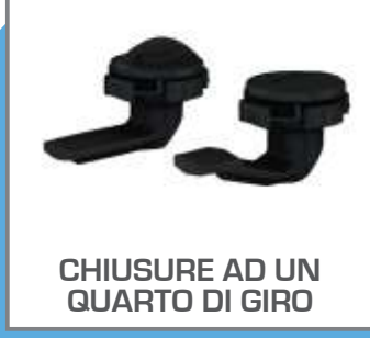
CHIUSURE AD UN QUARTO DI GIRO

CERNIERE CON GANCIO RICURVO, CERNIERE CON ARRESTO DI SICUREZZA, CERNIERE LUCCHETTABILI, CERNIERE CON SERRATURA