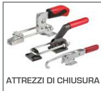
ATTREZZI DI CHIUSURA