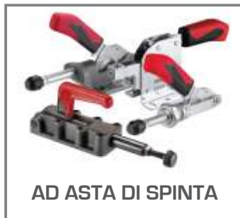
AD ASTA DI SPINTA