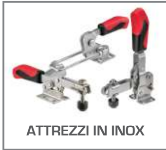
ATTREZZI IN INOX