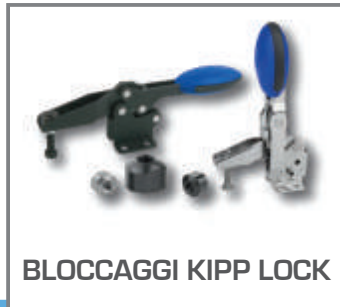
BLOCCAGGI KIPP LOCK