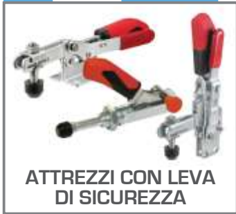
ATTREZZI CON LEVA DI SICUREZZA