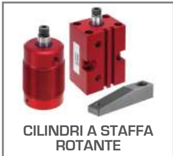
CILINDRI A STAFFA ROTANTE