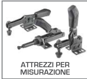
ATTREZZI PER MISURAZIONE