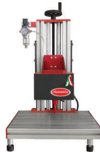
Base e colonna