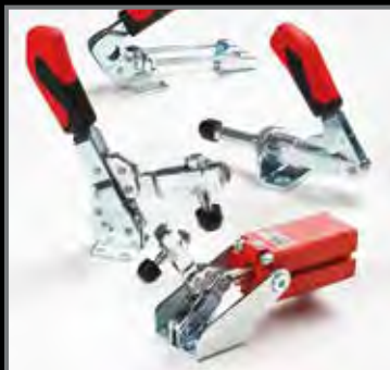
ATTREZZI DI BLOCCAGGIO RAPIDO