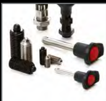
ELEMENTI DI POSIZIONAMENTO