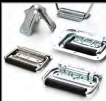
MANIGLIE E ACCESSORI PER CONTENITORI