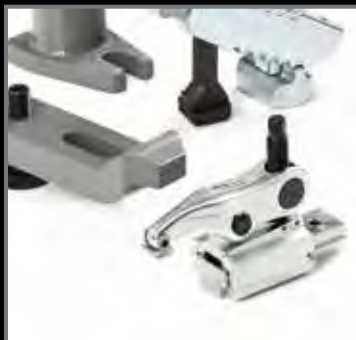
ELEMENTI DI STAFFAGGIO