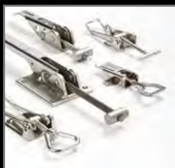
CHIUSURE A LEVA