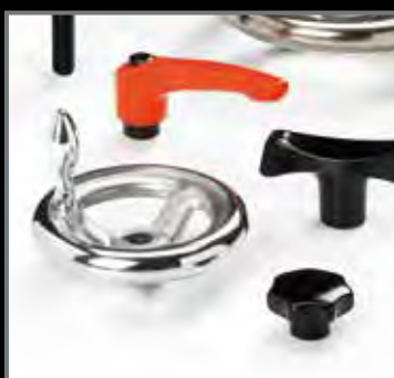
ELEMENTI DI MANOVRA