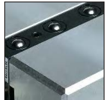
La tavola pressa è attrezzata con inserti di sollevamento ROLLBLOC durante l'utilizzo delle sottoplastre.

Se siete interessati a ricevere maggiori informazioni relativamente alle sottoplastre alla loro struttura e alle forme disponibili, siamo a vostra disposizione per fornirvi le notizie necessarie via telefono o presso la vostra sede realizzando un progetto specifico che incontri le vostre richieste particolari.